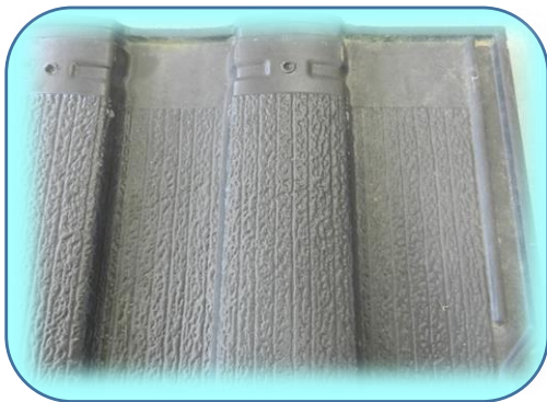
イオルーフ(ブルックⅠ)